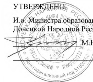
График проведения заседаний аттестационной комиссии III уровня Министерства образования и науки Донецкой Народной Республики в апреле 2019 г.